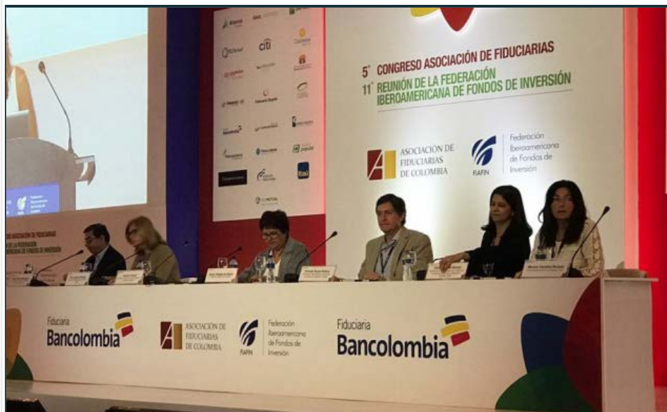
Onceava reunión de la Federación Iberoamericana de Fondos de Inversión, foto cedida